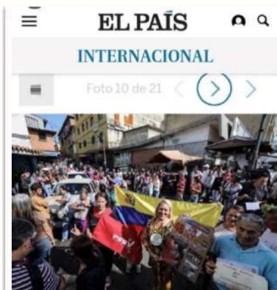
10 Chavistas esperan en la calle para votar en la consulta popular impulsada por los opositores del presidente Nicolás Maduro en Caracas (Venezuela).

Испанская газета “El País”, входящая в состав группы изданий правого толка «Групо Приса», признала факт использования фотографий, сделанных в ходе предварительных выборов, организованных Национальным избирательным советом (НИС) в воскресенье 16 июля, в качестве иллюстраций к проведенному так называемым «Круглым столом демократического единства» внутреннему референдуму. Министр Вильегас осудил в воскресенье некорректное использование фотоматериалов изданием “El País” с целью искажения реальной ситуации в Венесуэле, что может привести к негативным последствиям не только для южноамериканской страны, но и мира в целом. Это уже не первый раз, когда зарубежные СМИ, в первую очередь испанские, передергивают публикуемую информацию, используя фотографии столкновений и акций протеста из других стран, утверждая при этом, что речь идет о событиях в Венесуэле. Венесуэльское Агентство Новостей